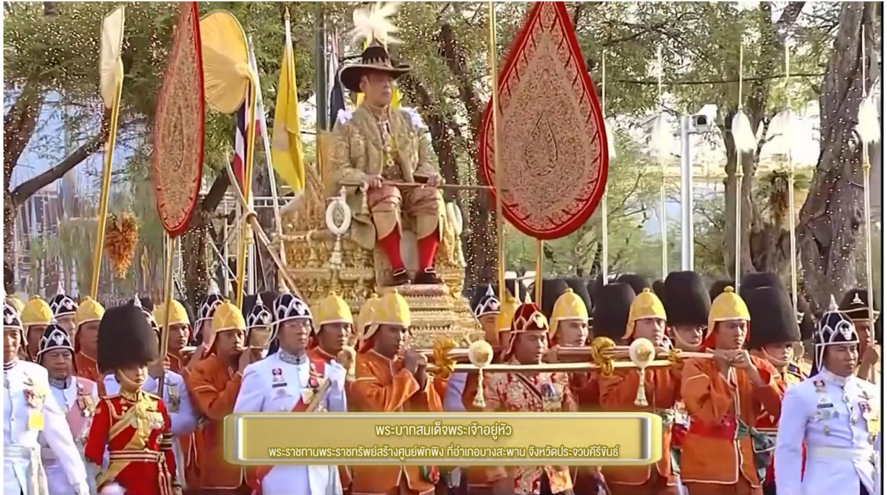
พระบาทสมเด็จพระเจ้าอยู่หัว พระราชทานพระราชทรัพย์ส่วนพระองค์ที่อำเภอบางสะพาน จังหวัดประจวบคีรีขันธ์